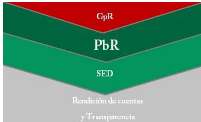
Esquema obtenido de la SHCP

mismo que se está implementando en Nayarit a partir de las diversas reformas constitucionales y legales aplicadas desde el 2008 a nivel nacional.