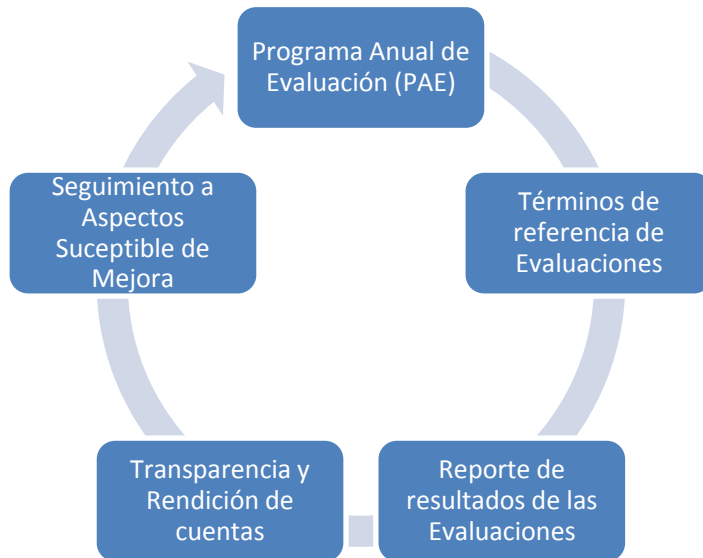
Esquema basado de la SHCP

El presente PAE forma parte del SED, en este último se plasma el conjunto de procesos y elementos metodológicos que permiten realizar sistemáticamente el seguimiento y la evaluación de las políticas, las instituciones y los programas implementados por las dependencias y entidades, para lograr un valor público. Ciclo del SED: