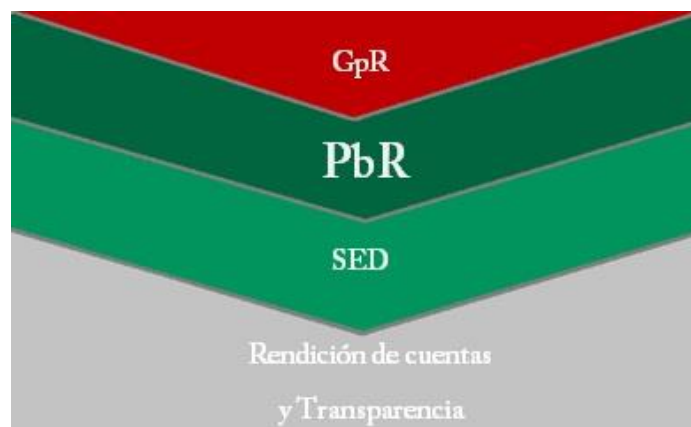
Esquema obtenido de la SHCP

El Sistema de Evaluación del Desempeño (SED) se liga con el Presupuesto basado en Resultados (PbR) en el Marco del nuevo Modelo de Gestión en base a Resultados (GbR), mismo que se está implementando en Nayarit a partir de las diversas reformas constitucionales y legales aplicadas desde el 2008 a nivel nacional.